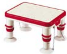
高さ調整付浴槽台