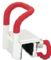
グリップ付浴槽手すり